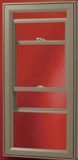
GUILLOTINE SIMPLE OU DOUBLE