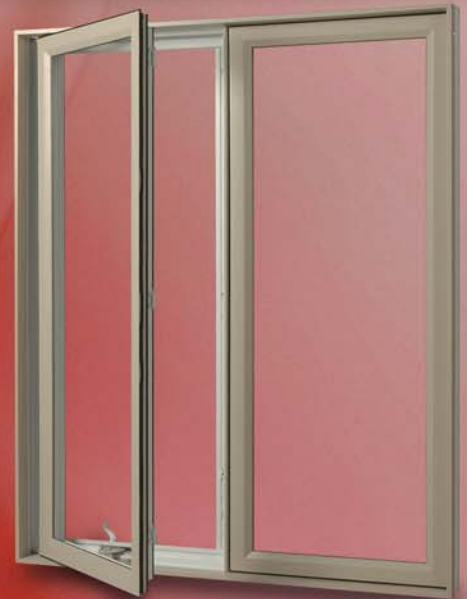
BATTANT OU AUVENT