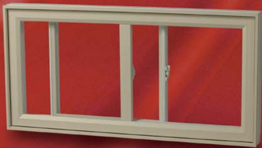
COULISSANT SIMPLE OU DOUBLE